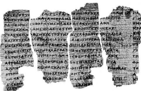
متون نوشته شده روی پاپيروس