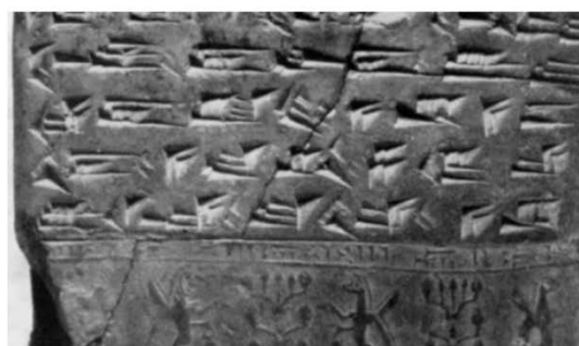
متن روی لوح گلی