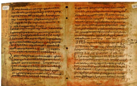
متون نوشته شده روی پوست