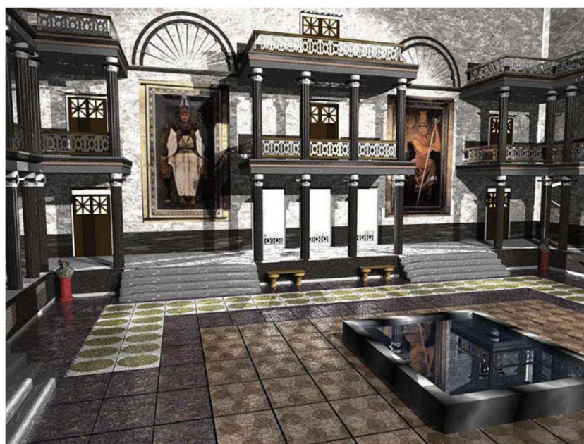
کتابخانه اسکندریه (بازسازی)