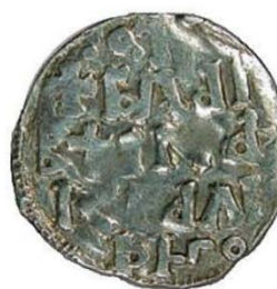
پول قرون وسطایی